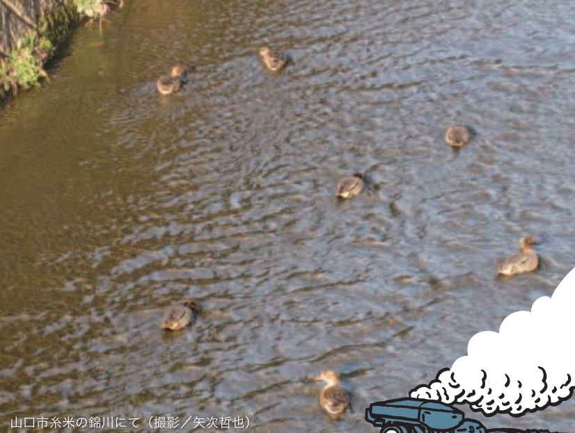
山口市糸米の錦川にて

白石地区地域づくり協議会 TEL 083-941-5959 〒753-0046 山口市本町1-1-25 FAX 083-941-5966 白石地域交流センター内 http://www.y-shiraishi.net/