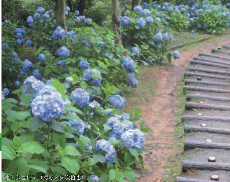
亀山公園にて

白石地区地域づくり協議会 TEL 083-941-5959 〒753-0046 山口市本町1-1-25 FAX 083-941-5966 白石地域交流センター内 http://www.y-shiraishi.net/