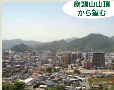
象頭山山頂から望む