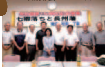
実行委員会メンバーのみなさん