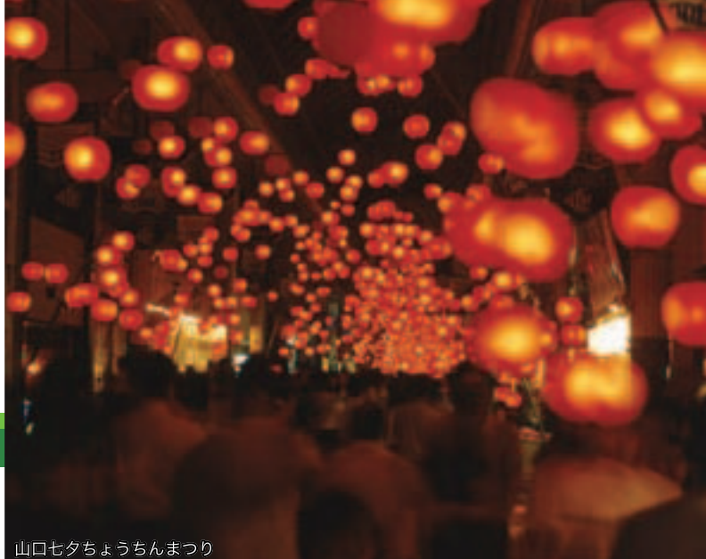
山口セタちゃんまつり

TEL 083-941-5959 FAX 083-941-5966 http://www.y-shiraishi.net/