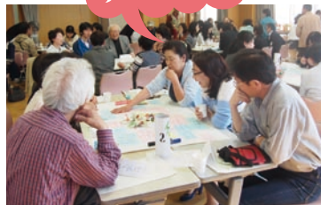
テーマの話し合い