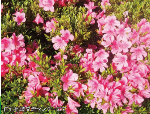
白石地域交流センターにて