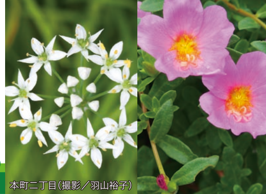
本町二丁目