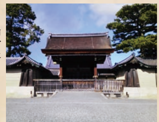
京都御所 建礼門(京都市)