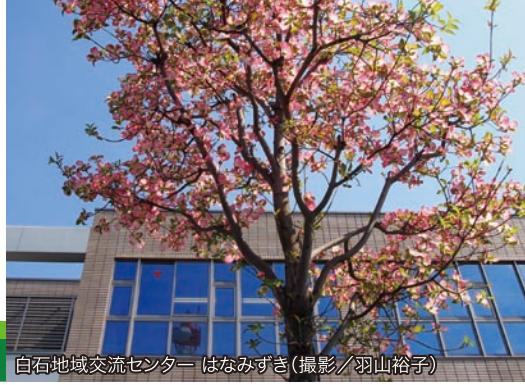
白石地域交流センター はなみずき