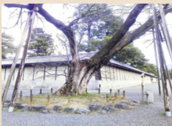
京都御所 樹齢約300年の清水谷家のムク(京都市)

元治元年(1864)6月15日、遊撃軍総督・来島又兵衛は、失地回復を目指し、兵を率いて京都へ向かいます。そして翌日には、