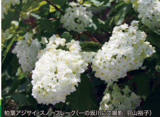
柏葉アジサイ・スノーフレーク(一の坂川にて)