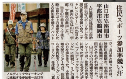
活動が朝日新聞に取り上げられました!!