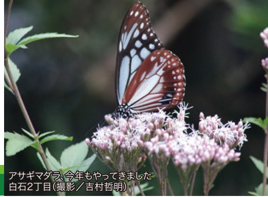
アサギマダラ、今年もやってきました 白石2丁目

http://www.y-shiraishi.net/ 携帯・スマホからは上のQRコードでアクセス!