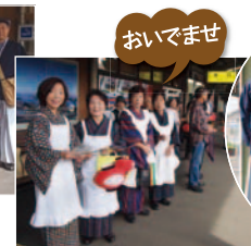
ちようちんで賑やかに