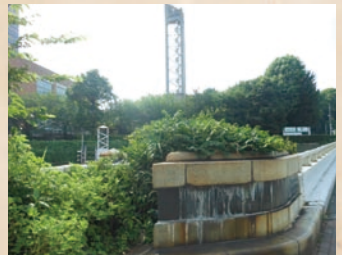
新御殿山橋より御殿山方面を望む(東京都品川区)

しかし、その後、武人らは、長州藩士だけを集め、御桶組を結成。同志を募り血盟書を作成したのでした。そして、同年12月12日、彼らは、品川御殿山に建設中の英国公使館に火を放ちます。公使館は炎を上げ、全焼したのでした。