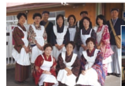
昭和レトロの衣装を身に 着けたアテンドのみなさん