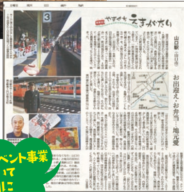
平成29年1月22日(日)掲載