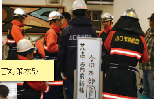
▲白石地域交流センター

平成29年1月22日(日)、昨年発生した熊本地震、鳥取中部地震を教訓に災害時の「自助・共助」を確認するため、中讃井町内会・西門前新橋町内会・荒高町内会が共同で、大原湖断層系地震(震度6弱)を想定して実働訓練を行いました。