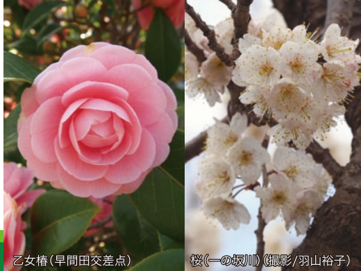
乙女椿(早間田交差点)