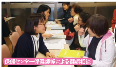
保健センター保健師等による健康相談

どなたでも、気軽に参加できる講座です。募集等、詳細は本年6月に地域づくり協議会だより等でご案内します。一緒に健康体質をゲットしましょう!楽しみにお待ちしておりますね!