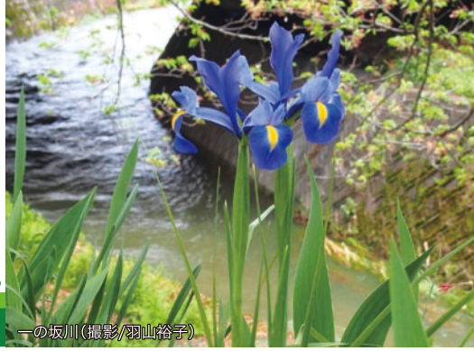
一の坂川