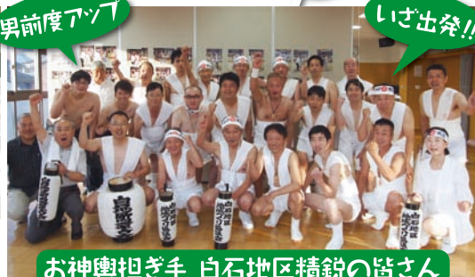
お神輿担ぎ手 白石地区精鋭の皆さん