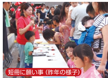
短冊に願い事(昨年の様子)