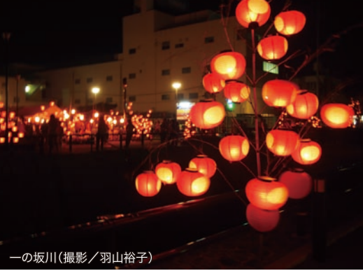
一の坂川