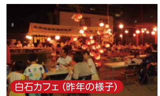
白石カフェ(昨年の様子)