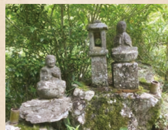
柳の水付近に座す石仏(滝町)

吉敷では、龍蔵寺境内の裏山にある「鼓の滝」を訪れ、湯田では「田植え」を見物したようです。