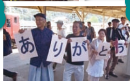
旧型客車をお見送り

昭和レトロ衣装を身にまとい、手作り手旗で歓迎! お月見をイメージした飾付で季節感を演出しました。