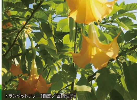
トランペットリリー

http://www.y-shiraishi.net/ 携帯・スマホからは上のQRコードでアクセス!