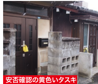
安否確認の黄色いタスキ