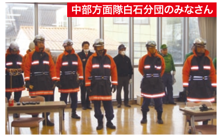
中部方面隊白石分団のみなさん

まず、大原湖断層を震源としたマグニチュード7.2、震度6強の地震が発生したという想定で、自主防災組織モデル実行委員会が地域防災本部を地域交流センター内に設置。訓練参加町内会(荒高・西門前新橋・中讃井・上清水)が黄色のタスキを利用したの安否確認訓練を行い、地域防災本部に状況を報告しました。その後、今年度訓練初参加となる上清水町内会にモデルになっていた、地域防災本部から防災士を派遣し、調査、本部への状況報告、避難所への誘導等を実施しました。