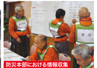
防災本部における情報収集