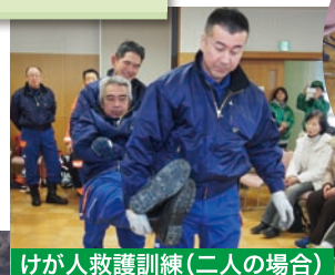
けが人救護訓練(二人の場合)