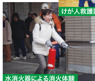
水消火器による消火体験