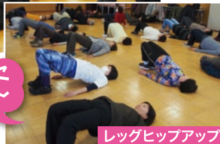
レッグヒップアップ