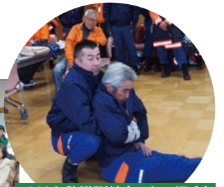
けが人救護訓練(一人の場合)