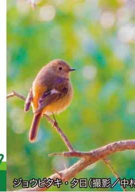
シヨウヒタギ・夕日

http://www.y-shiraishi.net/ 携帯・スマホからは上のQRコードでアクセス!