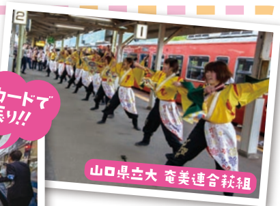
プラカードで手振り!!