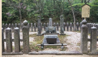
東行庵にある福田侠平の墓(下関市)

下関市吉田町にあります東行庵。ここには幕末の志士高杉晋作の墓がありますが、その隣に建てられているのが福田侠平の墓です。