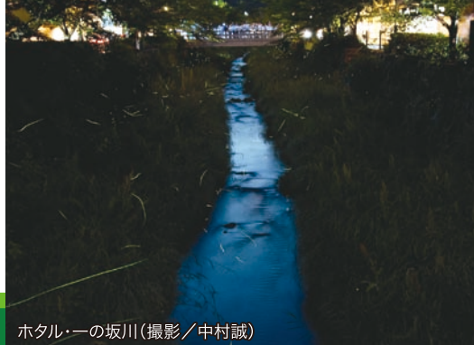
ホテル・一の坂川

http://www.y-shiraishi.net/ 携帯・スマホからは上のQRコードでアクセス!