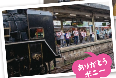
ありがとうポニー