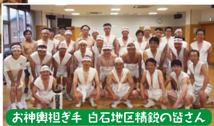
お神輿担ぎ手 白石地区精鋭の皆さん