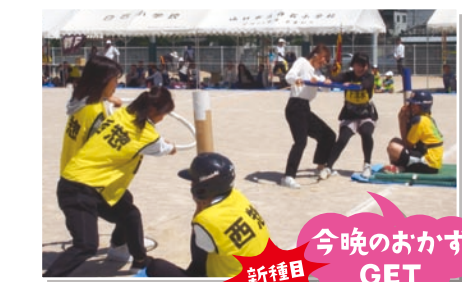
今晚のおかず 新種目 GET