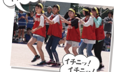
イチニッ! イチニッ!