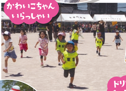
かわいいごちゃん いらっしゃい!