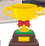
みなさん よくがんばりました