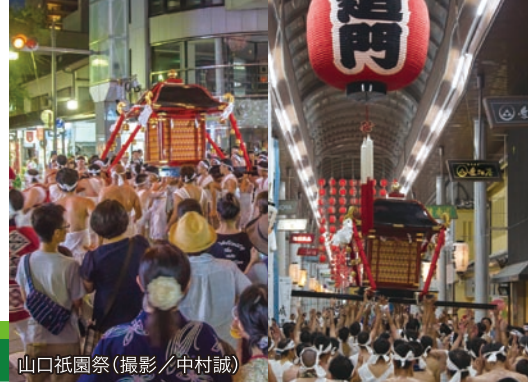
山口祇園祭