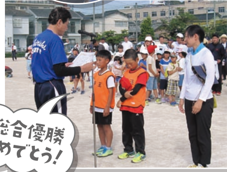
総合優勝 おめでとう!