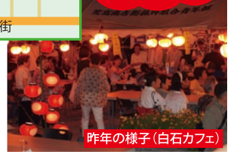
昨年の様子(白石カフェ)