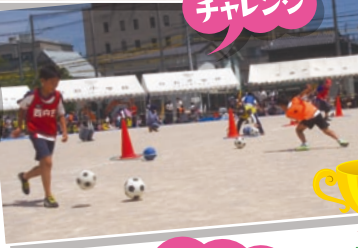
ドリブル チャレンジ