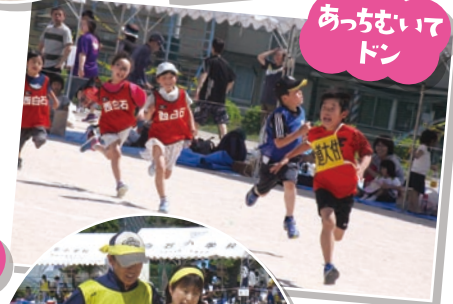
あっちむいて ドン