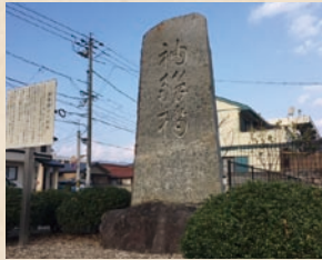
袖解橋の碑(三和町)

彼は、明治に入ると、5つ年長の馨と親しく交際するようになりますが、以前は馨のことを軽蔑していました。