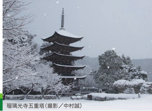
瑠璃光寺五重塔