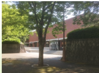
山口明倫館跡(山口市亀山町)

四書五経などを習う漢学寮がありました。文学寮の下には小学舎が置かれ、小学生教育として正式に制度化されていました。対象は7, 8歳から15, 6歳の藩士子弟でありました。