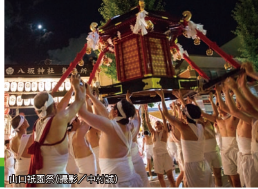
山口祇園祭