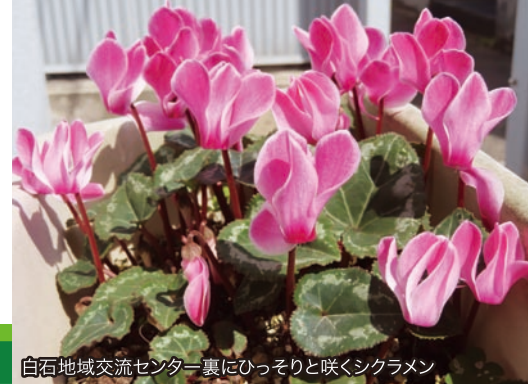
白石地域交流センター裏にひっそりと咲くシクラメン

http://www.y-shiraishi.net/ 携帯・スマホからは上のQRコードでアクセス!