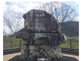
武人原の近くにある赤禰武人顕彰之碑(山口市旭町)