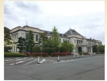
山口新屋形跡に建つ山口県旧県庁舎(山口市滝町)