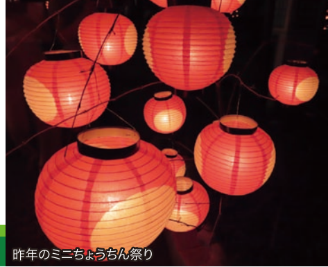
昨年のミニちょうちん祭り

http://www.y-shiraishi.net/ 携帯・スマホからは上のQRコードでアクセス!