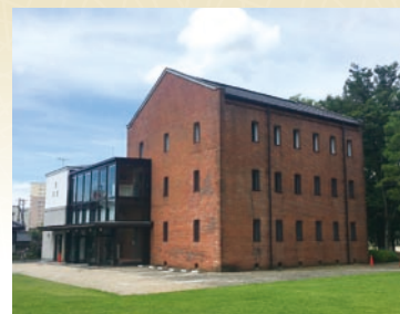
政事堂が置かれた山口御茶屋跡（山口市中河原町）

この敗報が山口に届いたのは、6日午前0時頃でした。この時、晋作は、敬親の命により山口に召致されています。