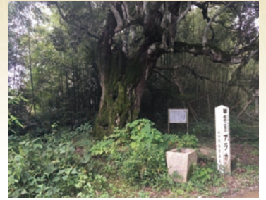
歴史の生き証人アラカシの巨樹 (山口市秋穂二島)

ここに駐屯していた隊士たちも、この木の周りで息を止め、様々な願いを胸に抱きながらグルグルと廻っていたのかもしれない。