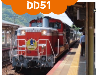
ディーゼル機関車 DD51