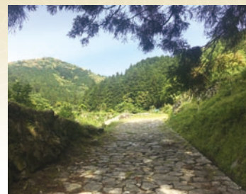
萩往還一ノ坂を進む (山口市上天花町)