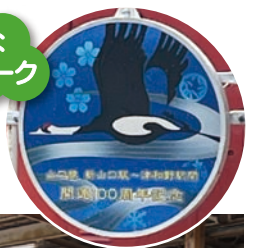
特別な ヘッドマーク