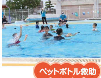
ペットボトル救助