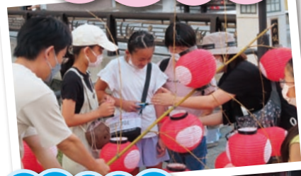
ちょうちんに火入れ