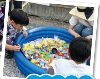
おもちゃプレゼント