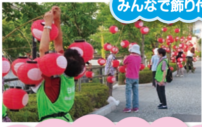
みんなで飾り付け♥