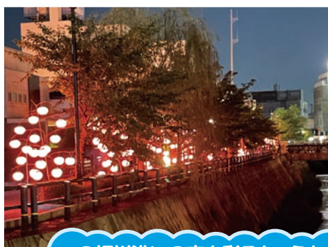
一の坂川沿いの夜を彩るちょうちん