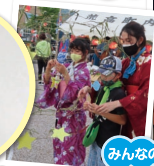
みんなの願い事かないますように