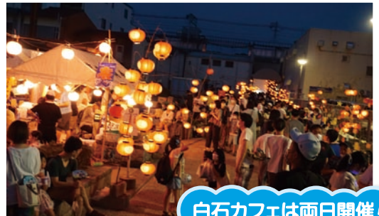
白石カフェは両日開催!

(ろうそく揺れるちょうちんの灯には、心の深いところをくすぐられる感じがしました。携わられた皆様、お疲れさまでした&ありがとうございました。取材：藤本)