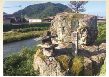
朝の光に照らされる重岩 (山口市鰐石町)