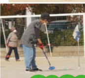
お疲れさまでした!