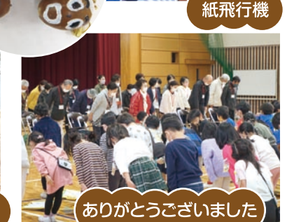
ありがとうございました