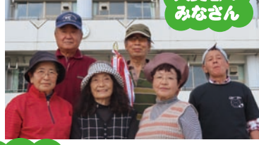
入賞者のみなさん