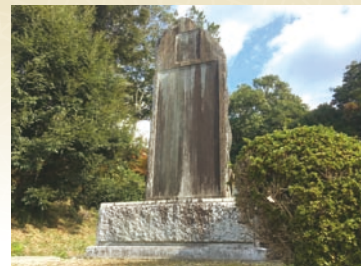
亀山公園にある来島又兵衛顕彰碑 (山口市亀山町)

晋作は、藩主・毛利敬親、世子・元徳の内命並びに世子の親書を携え、1月24日黄昏に山口を出発。夜半頃、宮市町の遊撃軍陣屋(現・防府天満宮大専坊跡)に到着。同軍総督の来島又兵衛に親書を渡して鎮静の儀を申し述べると、彼は親書を謹んで受け取り、藩主、世子のい