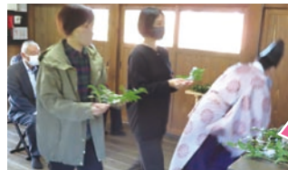
七夕のお願い事短冊

3年ぶりに築山神社で行なわれた神事の日、みんなの思いがきっと届くと感じられる、抜けるような青空でした。(取材:修理の終わった築山神社。初めて参拝しました… 藤本)