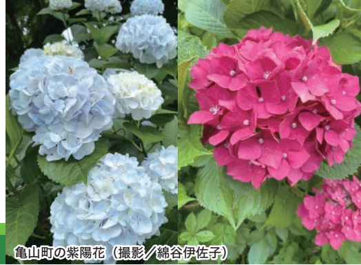
亀山町の紫陽花