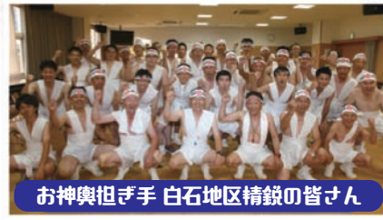
お神輿担ぎ手 白石地区精鋭の皆さん