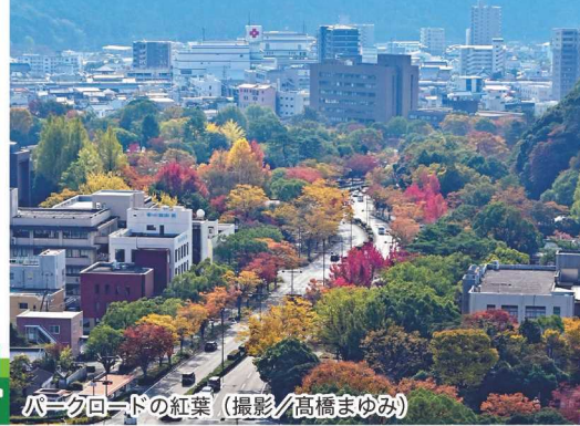
パークロードの紅葉

https://www.y-shiraishi.net/ 携帯・スマホからは上のQRコードでアクセス!