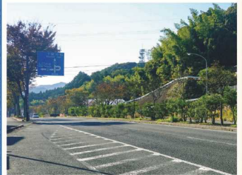
白石古墳群が調査された白石3丁目バス停付近