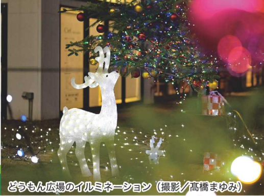
どうもん広場のイルミネーション