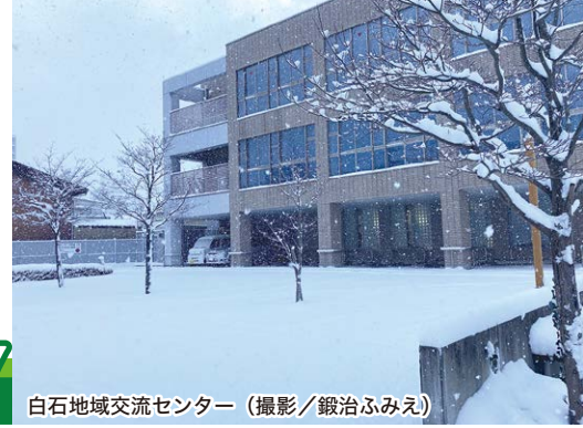
白石地域交流センター

https://y-shiraishi.net/ 携帯・スマホからは上のQRコードでアクセス!