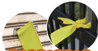
黄色いタスキで安否確認!

8:00 ~ 安否を知らせる黄色いタスキを玄関周りに掲げてください。 ※安否確認の際、無事を知らせる合図になります。