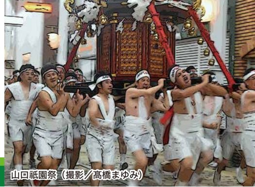
山口祇園祭