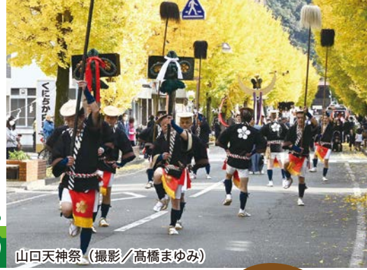
山口天神祭