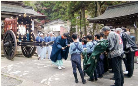
網代車前での出立式の様子（2018年撮影）

天神祭の日程は、表1に示されるように11月17日から25日までの9日間にわたります。皆さんよくご存じの御神幸祭（御神幸神事）は、11月23日に執り行われます。