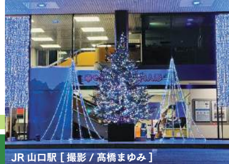
JR 山口駅