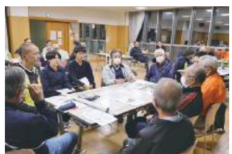
実 自主防災活動参加促進

来年3月の地区合同防災訓練へ向け、意識を高める機会となりました。(実行委員長 柳井 記)