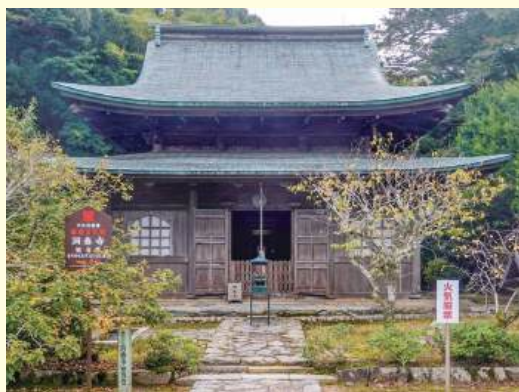
重要文化財 洞春寺観音堂

県が運営するWebサイト「山口県の文化財」によりますと、前回紹介した山門の建築年代は国清寺創建（応永7年〔1400〕）の頃、観音堂は永享2年（1430）と紹介しています。これは嘉吉2年（1442）頃の完成とされる国宝瑠璃光寺五重塔よりも古く、市内に残る大内氏ゆかりの建造物として、とても貴重な遺構と言えます。