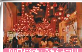
「山口七夕ちょうちんまつり」