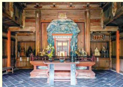
観音堂内部の様子