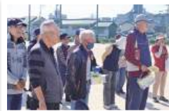
実 グラウンドゴルフ参加促進