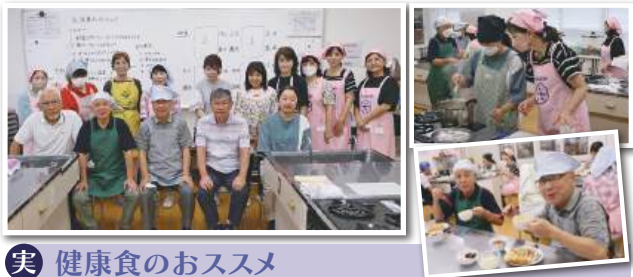
実 健康食のおススメ

フレイル予防に効果的とされるカルシウムやビタミンD、タンパク質などの栄養素が入った2種類のトーストや具たくさんミルクスープ等を、食推さんの丁寧な指導の下、楽しく料理することができました。(平川 記)