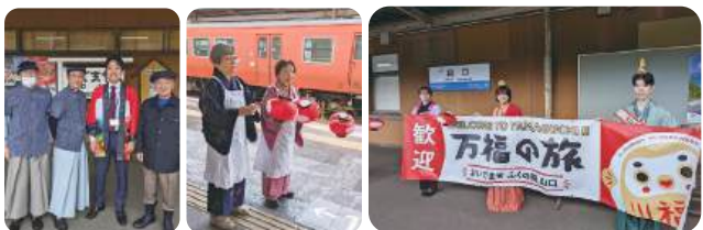
実 「やまぐちえき」応援イベント