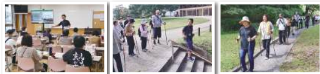
実 チャレンジ健康づくり

講座では、講師の杉田先生からウォーキングだけでなくポールを使ったストレッチなど、幅広い活用法を教えてくださいました。ノルディックポールを使ったウォーキング実践では、ポールを使用することで全身の筋肉を使うことや、歩行時の姿勢が良くなっていることが実感できました。(平川 記)