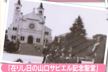
「在りし日の山口サビエル記念聖堂」